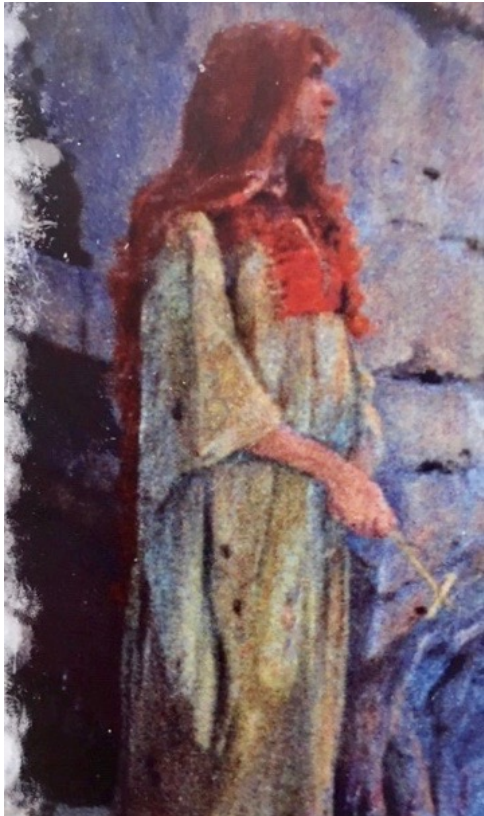
© R. Daimler/ Gemälde Hostellerie de la Sainte-Baume